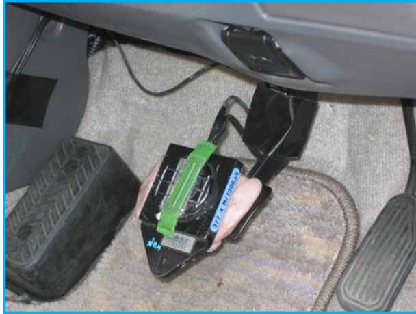
踏力計及びブレーキ開始トリガ用テープスイッチ