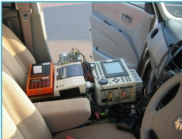
制動試験計装状態