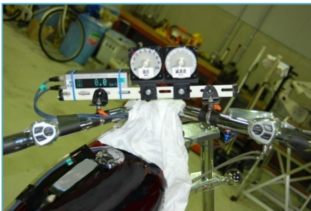
二輪車 モニターメータ(速度, 操作力, 減速度)